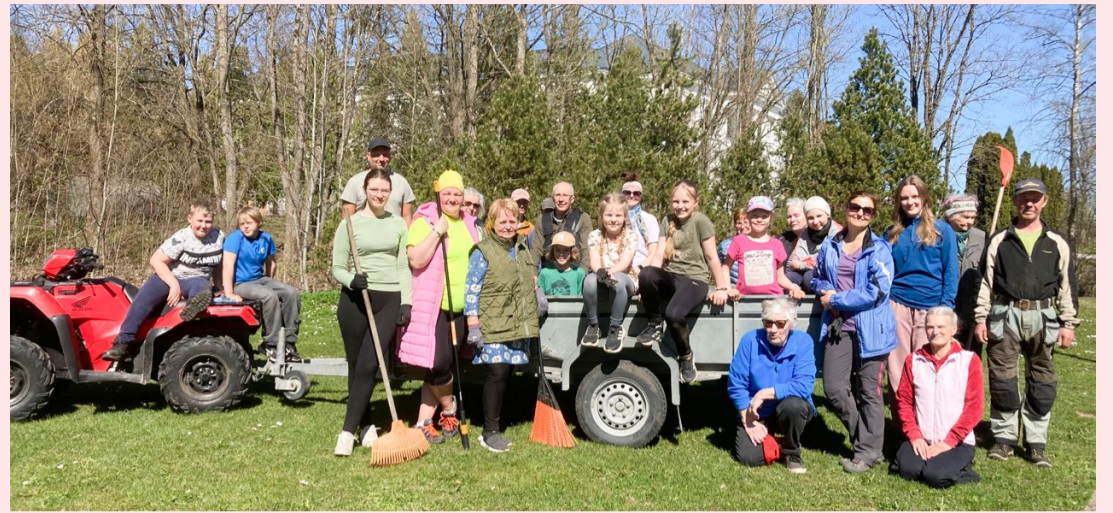
Kehtna talgupäeval osalejad.