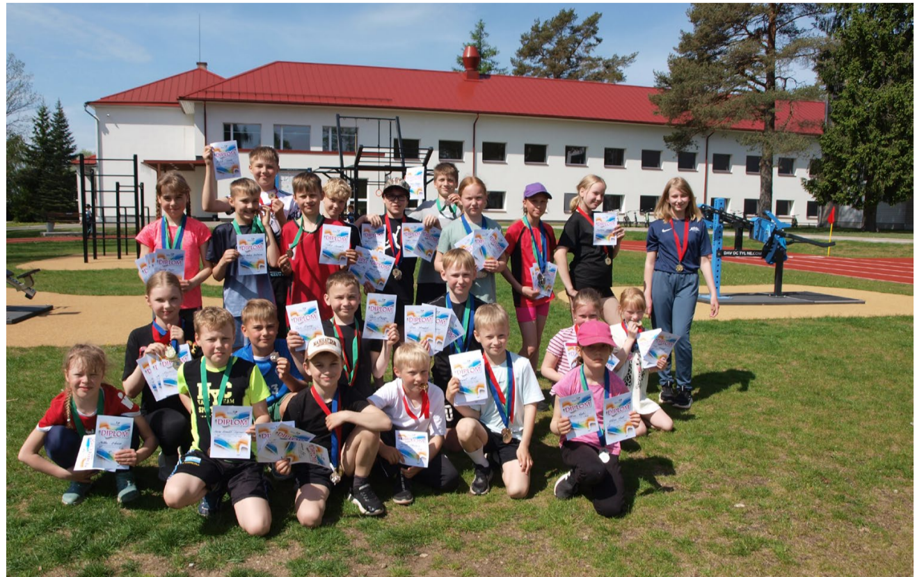
Ühispiilt medalisaajaist.