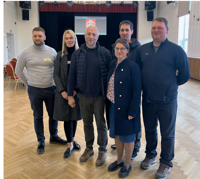
Foto tehtud Pärnu Rahvaulikoolis 05.05.2025, kus osa Kaiu kriisimeeskonnast osales koolitusel "Koo rohkem kui üksi – kriisivalmidus kogukonnast".

Koolitusest innustatuna alustasime Kaiu kandi kriisiplaani koostamist. Esmalt