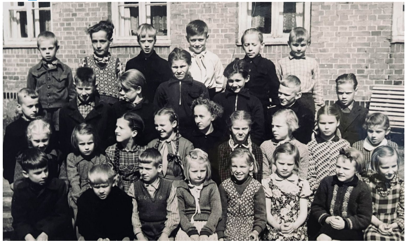
1959. aasta kevadest pärit pildil on läbisegi I ja III klassi õpilased.