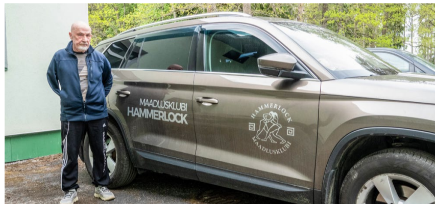
Hammerlock oli esimene maadlusklubi Eestis, kes lasi oma logo auto peale panna.

tis ta kolmanda koha sumomaadluse Euroopa meistrivõistluste individuaalarvestuses ja ka võistkondlikult.