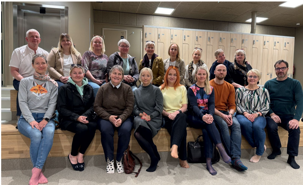
Raplamaa projekti juhtrühma ja vallavanemate visiit Soome 5.–6. mail.