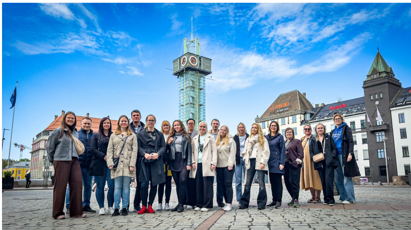
Omavalitsuste kommunikatsioonitöötajatele õppereisist osavõtjate ühispilt Oslos.