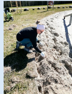
Ave Randmäe Aleti puhkeala korrastamas.

Koostöös Järvakandi Kooli Eidapere õpipaiga inimestega saime pakkuda talgulistele kooli sööklä ruumides suppi ja iseküpsetatud leiba ning kohupiimakooki.