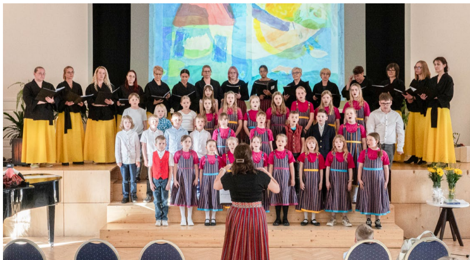
Ühendkoorid esinemas RAKO saalis.

nii esinejatele kui ka kuulajatele ning jääb kindlasti kõigile osalejatele kauniks mälestuseks.