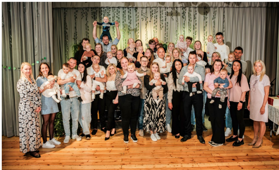
2025. aastal sündinud lapsed koos vanematega valla hõbelusika pidulikul vastuvõtul Lelle Rahvamajas.

oli kingituste üleandmine. Traditsiooniliselt said väikesed vallakodanikud mälestuseks hõbelusika ja nimetunnistuse – sümbolised kingitused, mis jäävad meenutama elu alguses tehtud esimesi samme ning seda erilist päeva. Lisaks said pered kingituseks raamatu „Pisike puu“, mille on valla peredele saatnud Kultuuriministeerium ja Eesti Lastekirjanduse Keskus. Raamatute maailm aitab luua ühiseid lugemishetki ning toetab lapse ku-