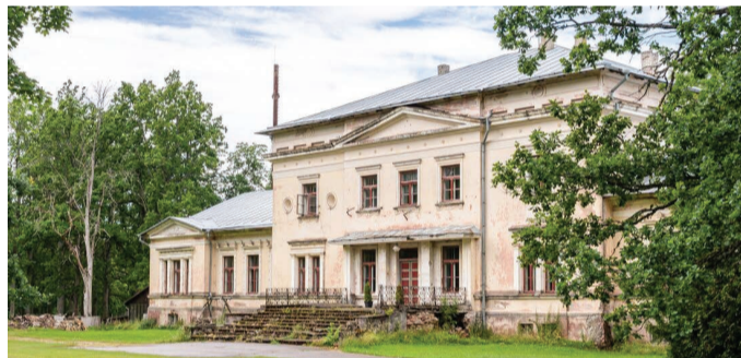
Lelle mõis.

Käesoleva aasta detsembris möödub 120 aastat mõisade põletamisest Eestis. 12.–20. detsembril 1905 põletasid ja rüüstasid salgad Eestis täielikult või osaliselt 160 mõisat ja 40 viinavabrikut. Hävis palju ajaloolise ja kultuurilise väärtusega esemeid, mõisnike kahjud ulatusid ametlikel andmetel 3,2 miljoni rublani.