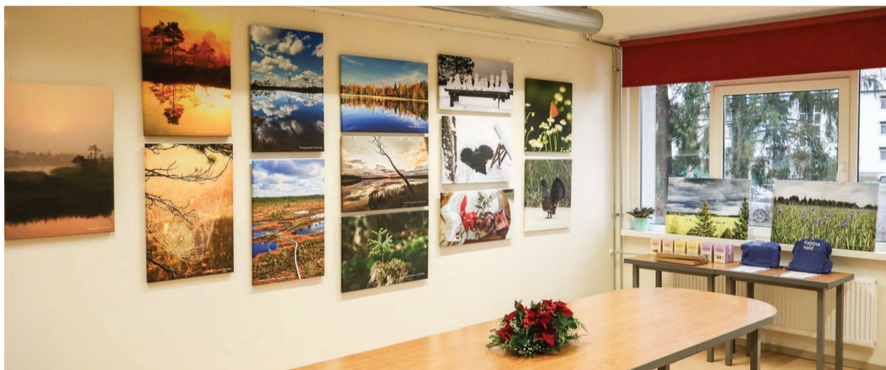
2. detsembril avati Kehtna Raamatukogus Fotokonkurss „Südamepaik Kehtna vallas“ valiknäitus.

Rahulikku jõuluaega peredega ja parimat saabuvat uut aastat kõigile