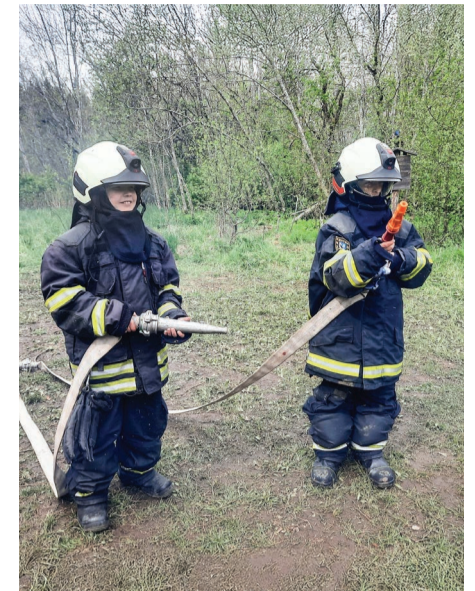
Keava noored kotkad õpitoas.