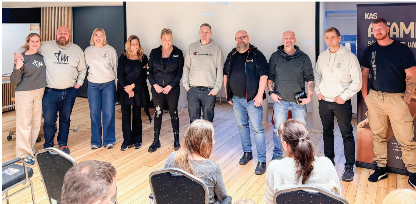
Seminari korraldajad koos välisekspertidega ühisel pildil.