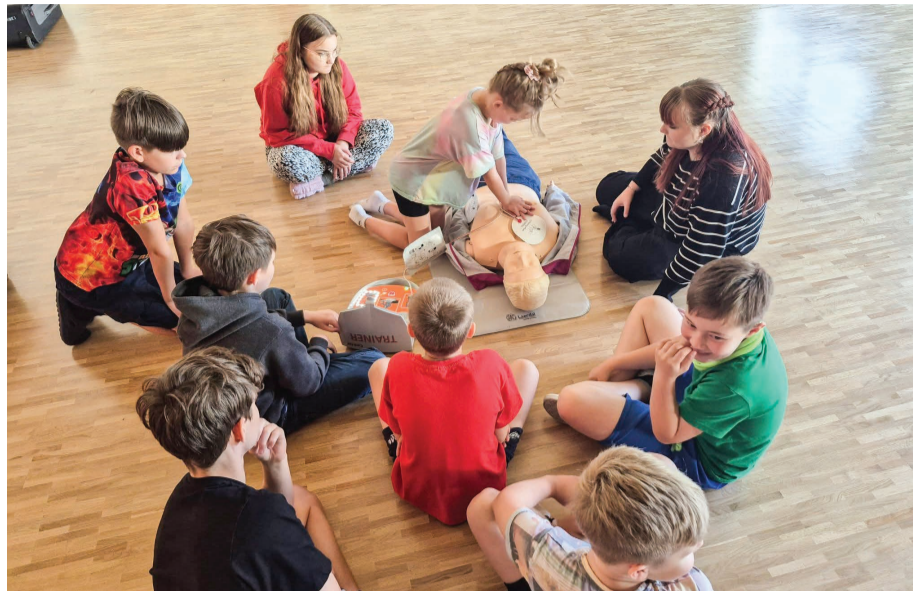
Keava noored kotkad ametit harjutmas.

Maie Käsper Kaerepere kodutütarde rühmavanem