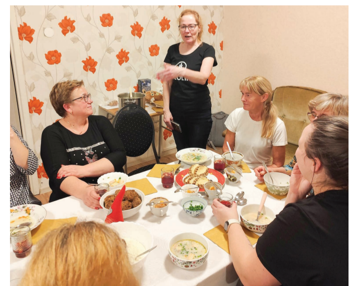
Kokandusklubi liikmed ühise laua taga.

Tekst ja fotod Katrin Jair Eidapere Kultuurikeskuse juhataja