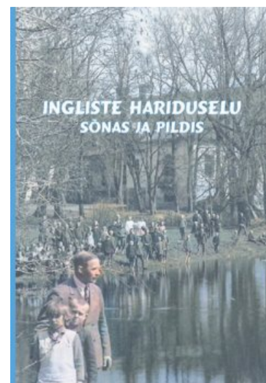
Raamat „Inglite hariduselu sõnas ja pildis“ pälvis Kehtna valla haridusteo tiitli 2023.