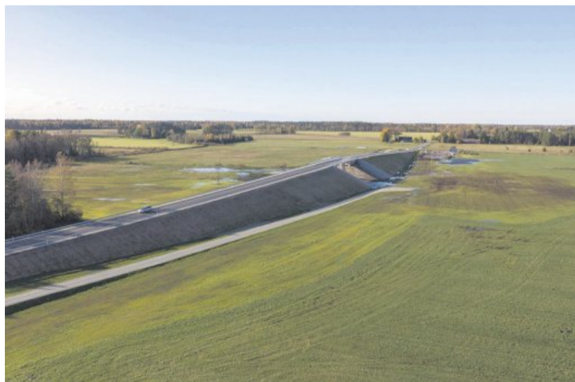
Rail Baltica Kehtna-Põlma vastvalminud viadukt

Omanikujärelevalve: Sweco Est OÜ, insener - Jaanus Heinla, 5333 2113 Tähtaeg: 2.09.2024, tegelik valmimine 2023. aasta lõpp