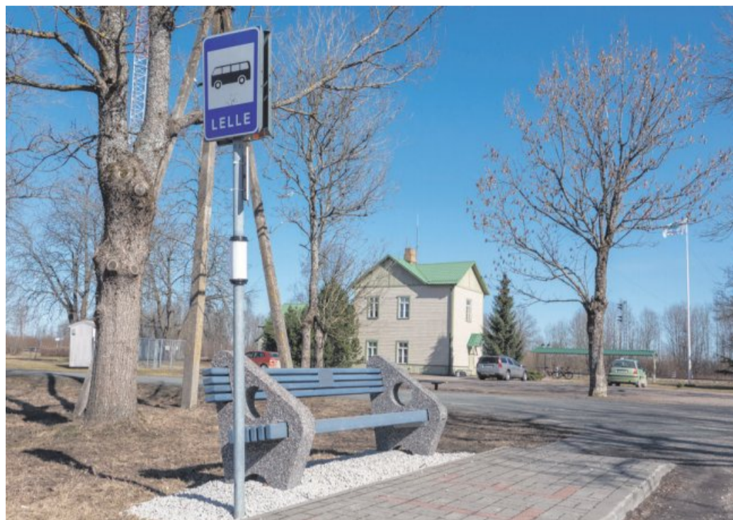
Lelle raudteejaamale ja endisele postijaamale pühendatud pink.

Kokku läksid 6 pinki koos paigaldusega ja muude kuludega maksma 3609,80 eurot. Raha pinkide rajamiseks saime Kohaliku Omaalgatuse Programmi „Investeeringud ja kogukonnateenuste arendamine“ taotlusvoorst ja Kehtna vallast MTÜ-de toetuste taotlemise voorst. Lisaks omaosalus projekti elluviimiseks MTÜ Meie Lelle Seltsi abiga.