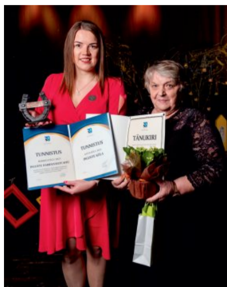
AASTA KÜLA 2023