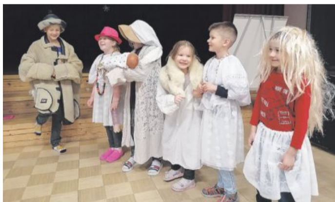
Mardisant on õnnepant. Kehtna Põhikooli I kooliastme mardis- ja kadrikommete tutvustus.

Kõige tähtsam on meeles pidada, et sandid käivad õnne jagamas, mitte kommi lunimas. Seda peavad meeles pidama