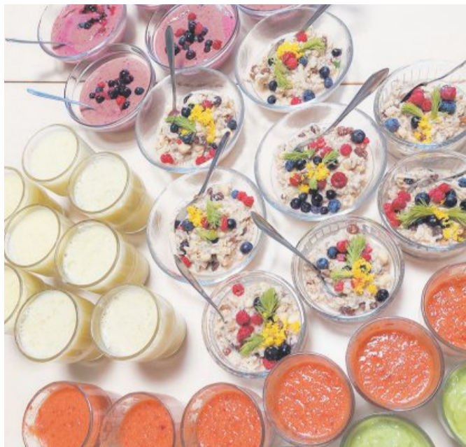
Väärikate kokandusklubi kokkusaamisel degusteeriti toitumissoovituste põhjal kokku pandud roogasid.

2023. aasta on ka liikumisaasta, mis omakorda jagatud teemakuudeks. Esiletõstetud liikumisharrastused aprillis olid kõndimine, jooksmine ja tantsi-