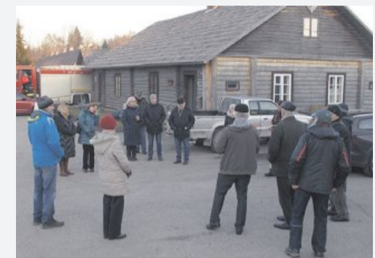
29. märtsi õhtul süüdati Järvakandi klaasimuseumi juures Suure Lennu tuli.