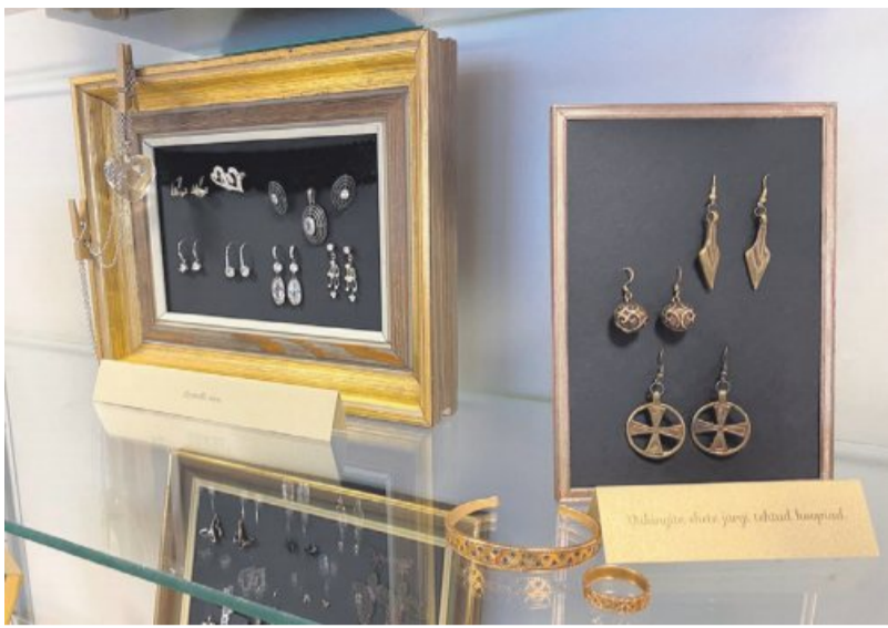
Näitusel on ehted jagatud gruppideks.