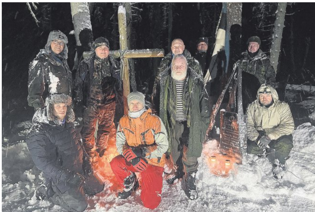
Iga aasta 14. detsembril koguneb väike seltskond Eidapere külje all asuva mälestuskivi juurde, et tõsta üheks öhtuks tähelepanu keskpunkti metsavendade pärand.

See asub Eidaperest mõni kilomeeter lõuna pool. Kui jätta kõrvale 14. detsembri üritus, siis väga palju seal rohkem ei käidagi. (Järg 3. lk)