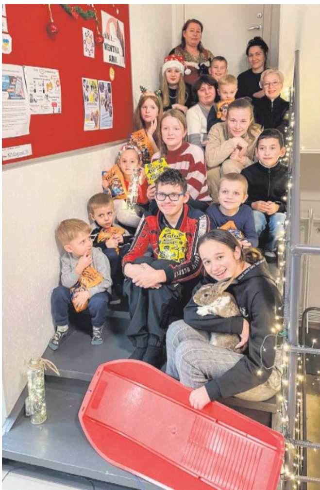
Kehtna vallas elavate ukraina perede ühine jõuluõhtu Kehtna Noortekeskuses.