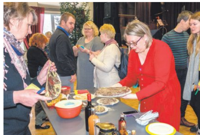
Hindamiskomisjon valmistub jõulutooteid hindama.

Ilmselt märkate, et parima jõuluvorsti kategooria võitja on