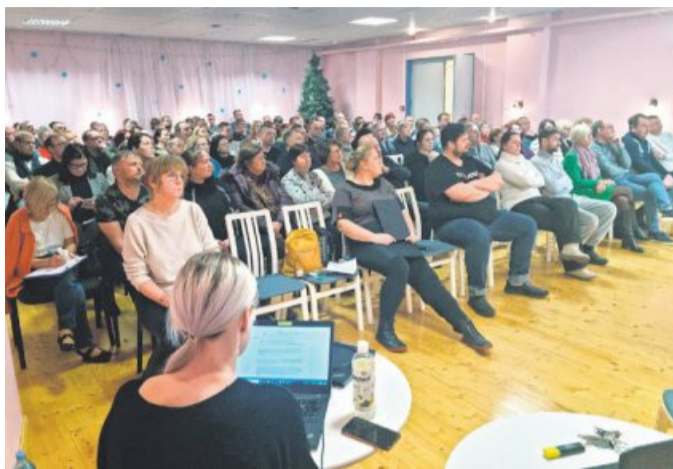
Koosolek valla esindajatega Eidapere Koolis.

Hetkega olid teema sisulise poole taga ühiselt kooli hoolekogu, lapsevanemad ja kogukond. Üheskoos otsiti välja avalikult kättesaadav info, sest