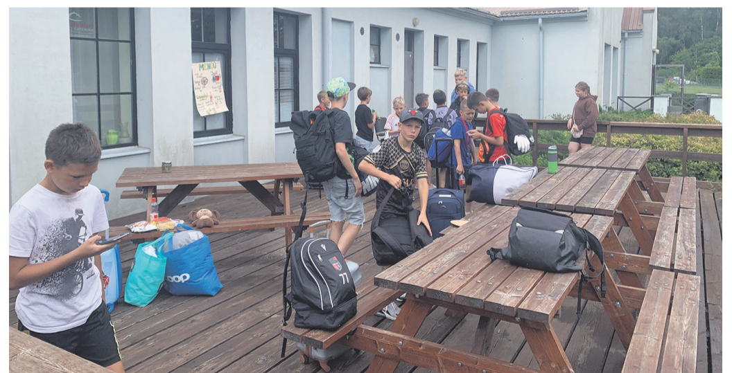
Malevlaste vahvlikohvik Valtu Spordimaja terrassil.