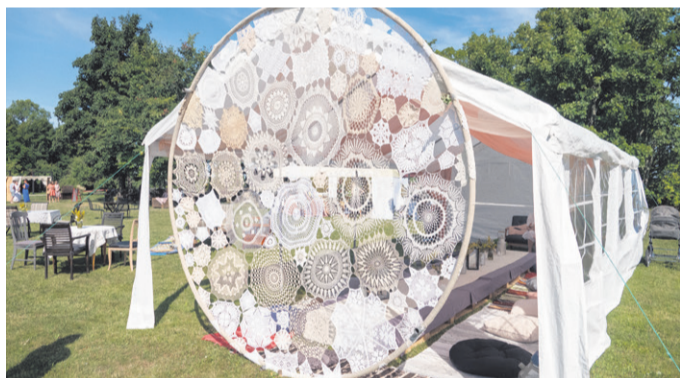
Loobergi talus pakkusid silmailu vana batuudi raamile kinnitatud pitslinnikud.