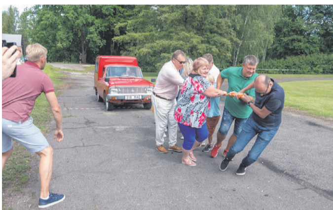
Võistluse "Stardiabi" võitjaks osutus hindamiskomisjon. Hindamiskomisjoni külaskäik Kaerepere alevikku.