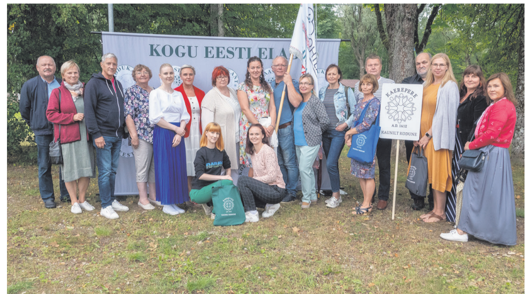
Raplamaa esindajad Sadalas Jõgevamaal.

Kaerepere piirkonna vaba-ahtlikud eestvedajad on alates 2007. aastast koondunud MTÜ Arendusselts Koduaseme ridadesse, mille eesmärk on Kaerepere aleviku ja sellega piirnevate külade mitmekesine kultuuri-, haridus- ja sporditegevus, heakord ja ühtne kogukond, muinsuskaitse, säilitatud kultuuripärand, loodus- ja huvikaitse ning head võimalused igas vanuses elanikkonna vaba aja veetmiseks