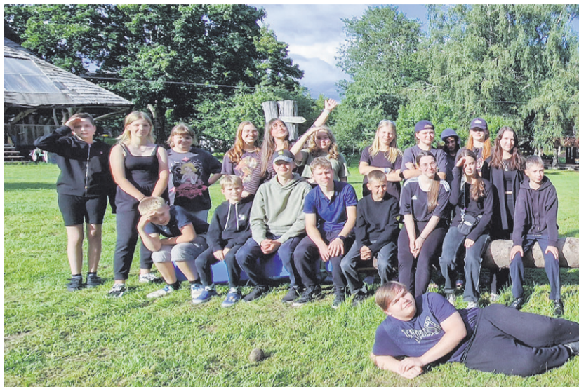
Grupp augustikuu pärimuslaagris osalejaid.

14.-17. juunini olid Kooliteatrite suvekooli noorema vahetuse imeilusad ilmad taas meid rõõmustamas ja suvekool pakkus vahvaid elamusi ligi sajale lapsele ja noorele. Töögruppides jagasid oma kogemusi ja oskusi Viljandi Kultuuriakadeemia kogukonna hariduse ja huvitegevuse kursuse üliõpilased (juhendaja Katrin Nielsen), lisaks õhtused lõkked, maastikumängud, vaba