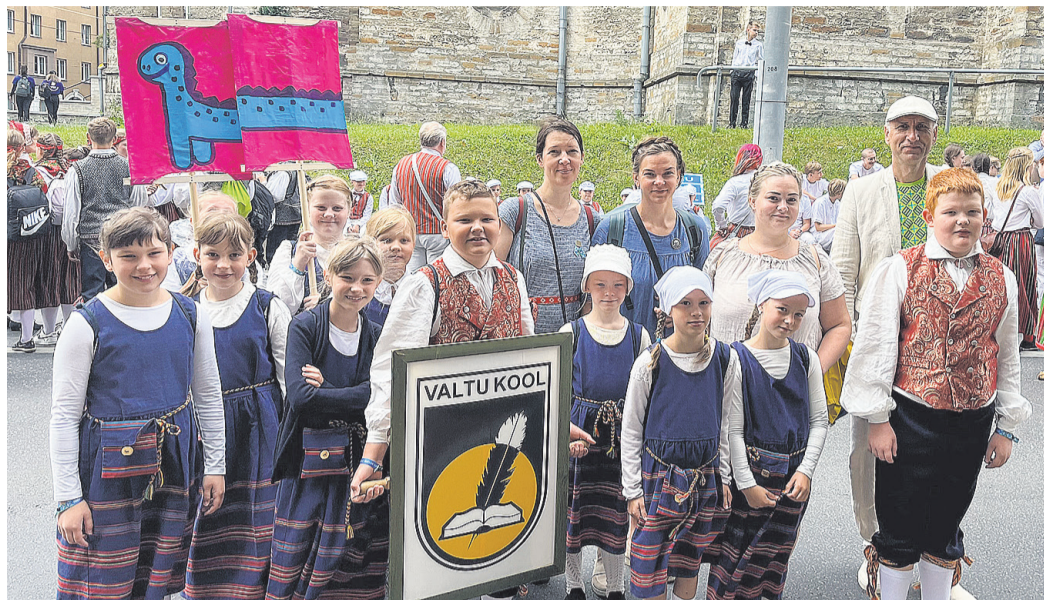
Valtu Põhikooli õpilased koos juhendajatega laulu- ja tantsupeol.

Laulupeo repertuaar kõnetas nii osalejaid kui ka publikut, keda oli kohale tulnud vihmajärgsest hoolimata suur hulk. Rohkem kui seitse tundi väldanud teleülekanne kogus ETVs keskmiselt 160 000 vaatajat. Peo kulminatsioonina kõlanud ühendkooride esitusi nautis televahendusel üle 200 000 vaataja, tipp hetkel vaatas üle-