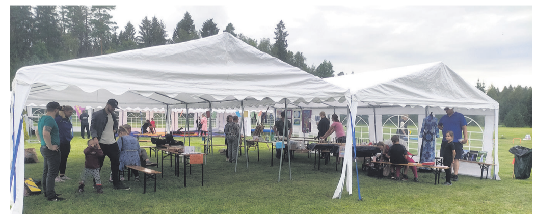
Spordi- ja lustipäevast osavõtt Järvakandis jäi hõredaks.