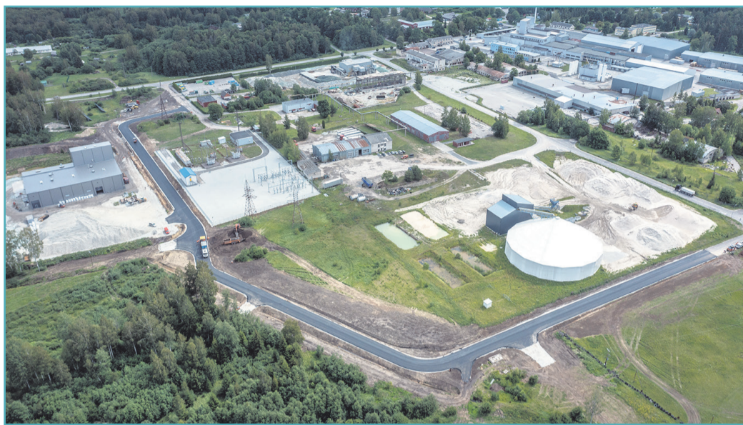
Järvakandi tööstuspark linnulennult.