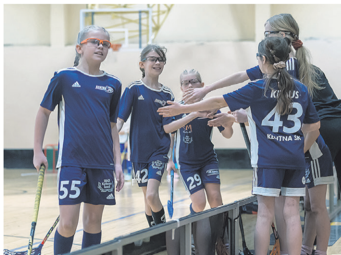
U11 tüdrukute MV turniiripäev Kehtna Põhikoolis.