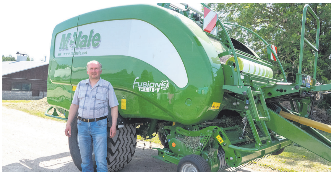
McHale kombipress on talus alles mõned päevad tööd teinud. Masin tõmbab kokkurullitud rohule võrgu ümber ja tagumises kambris algab kiletusprotsess.