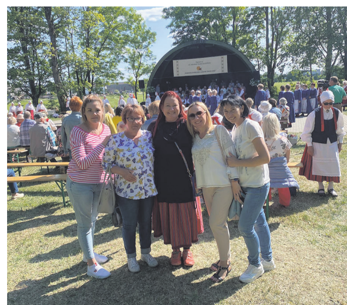
Ukraina sõjapõgenikud Nedsaja Küla Bändiga memme-taadi suvepeol Kehtna laululaval.