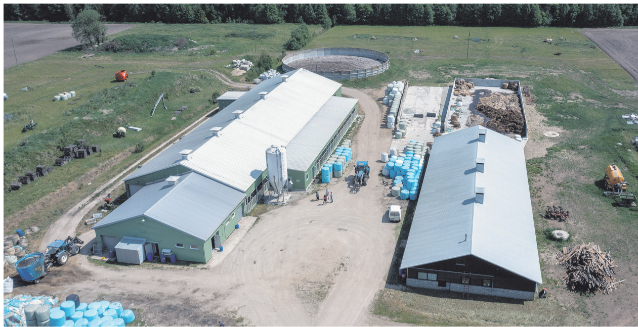
PRIA toetuse ja pangalaenu ehitati välja lauda laiendus, tänapäevane läghoidla ning soetati robotlõpsimasin ja uut tehnikat.

Robot nimega Merlin soetati PRIA toel Inglismaalt. Veel õnnestus sama projektiga ehitada lauda laiendus, sönnikuhoidla ja soetada uus, parem ja