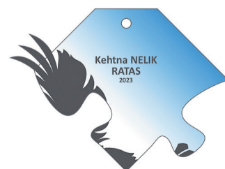
Rattasõidu Kehtna NELIK medal.