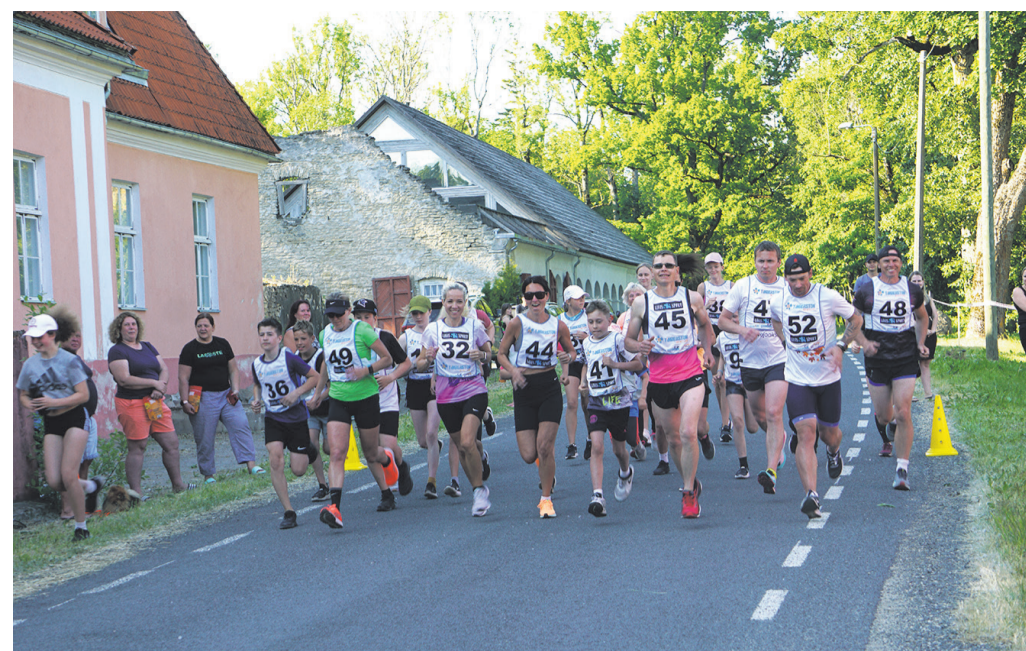
Ingliste mõisa jooksu stardipauk on kõlanud ja ees ootab 5 km pikkune distants.

Kaereperes toimunud võistlusel kasutati ujumiselt rattasõidule üleminekuks Gunderseni meetodit. See tähendab, et pärast ujumist oli lühike puhkepaus ning siis läksid võistlejad vastavalt ajavahedele uuesti rajale. Triatloni kõrval toimusid ka noorte- ja lasteduatlon. Kokku oli tol pühapäeval Kaereperes 24 võistlejat.