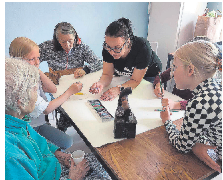
Erinevate põlvkondade kohtumine Järvakandi hooldekodus.