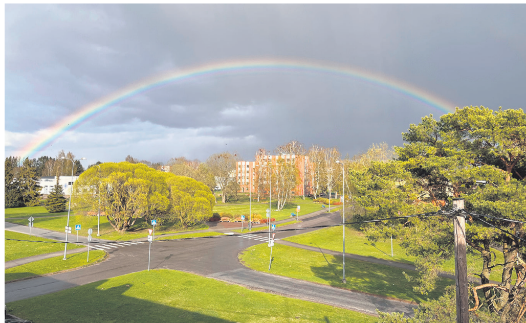
Facebooki lemmikuks sai foto „Terve Kehtna vikerkaar“.