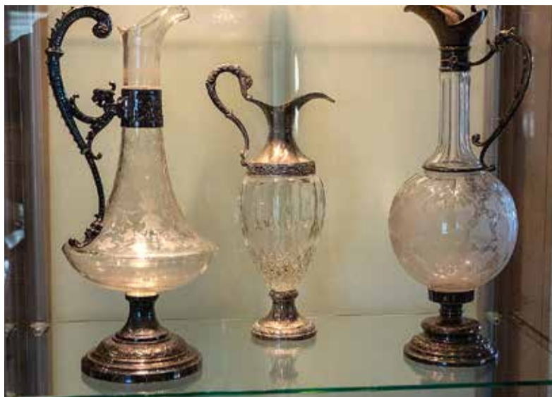
Klaasimuseumis on vitriinides üle saja unikaalse karahvini.