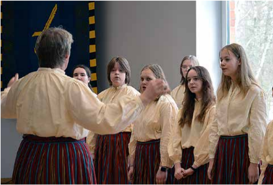
Hetk emadepäeva kontserdilt.