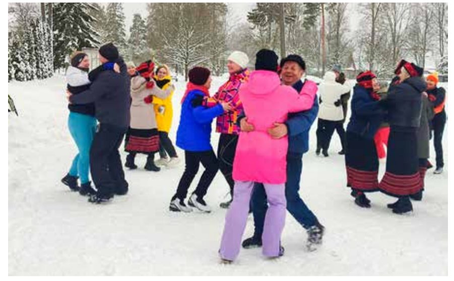
Rõõm koos tantsimisest.

Tekst ja foto Katrin Jair, Järvakandi Kultuurihalli juhataja