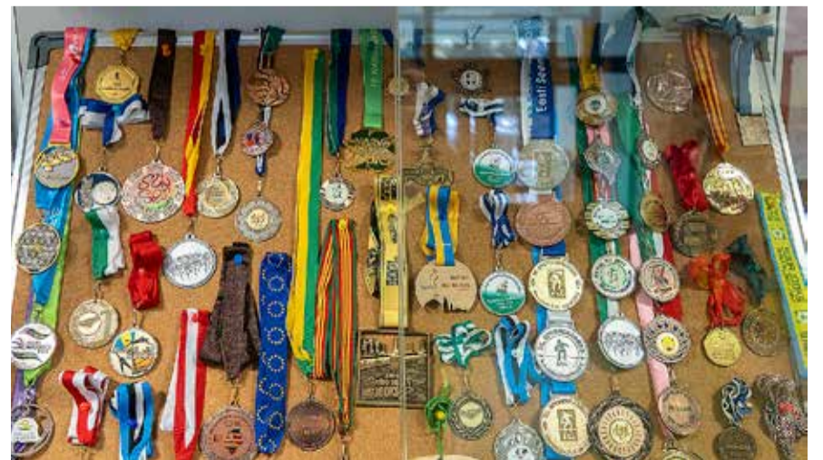
Reelika Laesi medalid.