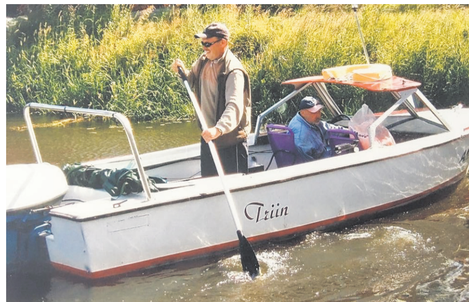
Väljasõit Leoniga Peipsi peale kala püüdma.

Õnnesoovidega ühinevad Inglise piirkonna eakate klubi liikmed, endised kolleegid ja õpilased.