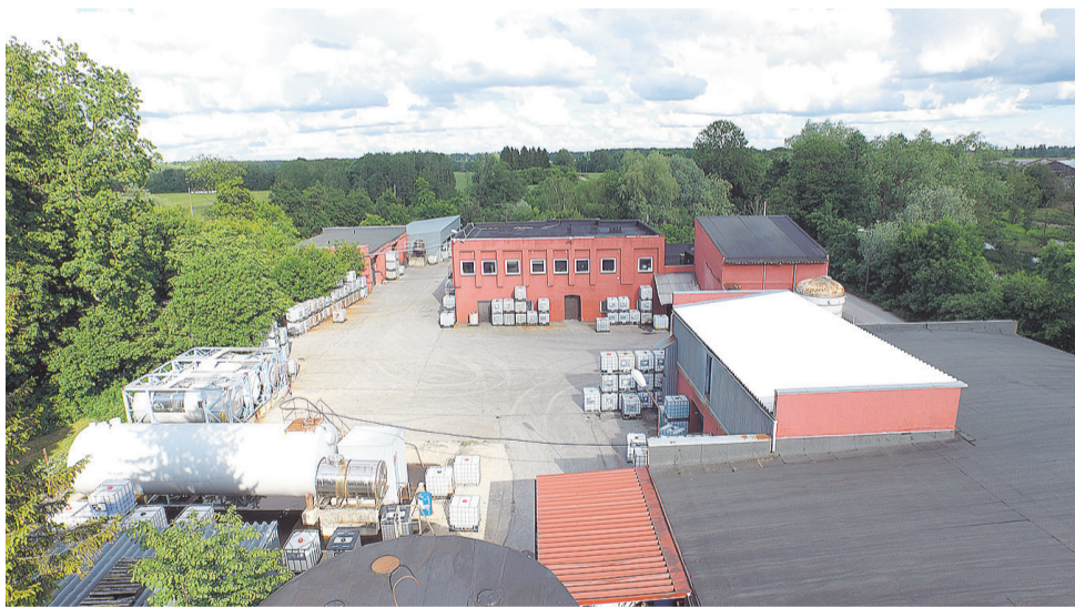
AS Ingle sai alguse sellest Estosteriili tsehhist.