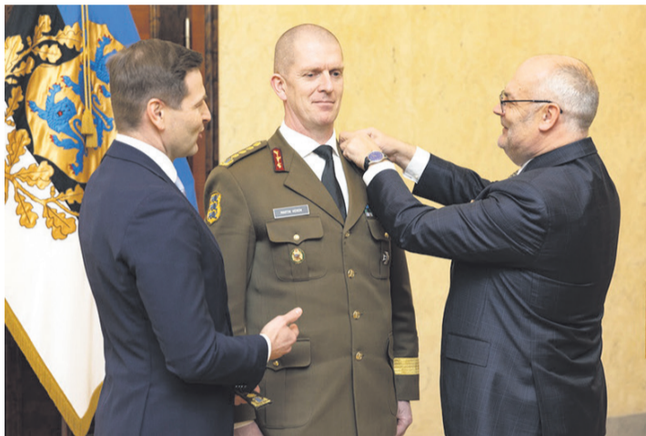
President Alar Karis andis kaitseväge juhatajale kindralleitnant Martin Heremile kindrali sõjaväelise auastme.

Riigipea tõstis esile kaitseväge juhataja tööd kaitseväes uue relvastuse kasutusele võtmisel, reservväe valmiduse tõstmisel, sealhulgas läbi reservõppekogunemiste ning piirkondliku sõjalise koostöö tihendamisel. Samuti on kindral Heremi juhtimisel tagatud NATO liitlasüksuste vas-