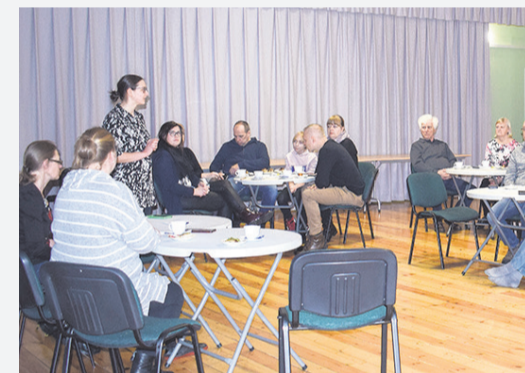
Kogukonnaõhtu Lelle Rahvamajas.