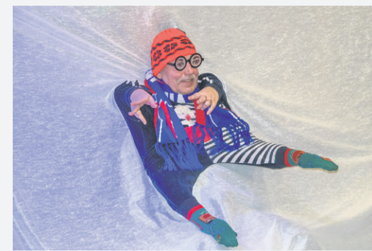
Salapärase peokülaline Järvakandi Kultuurihalli 35. sünnipäeval.