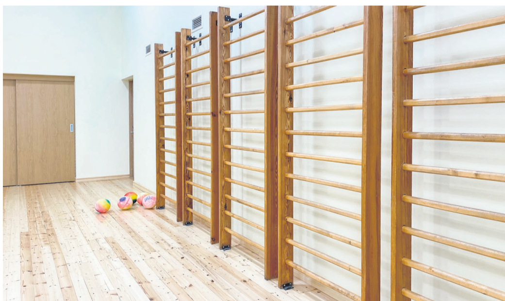
Võimlas vahetati lagi, viimistleti seinad ja lihviti põrand.