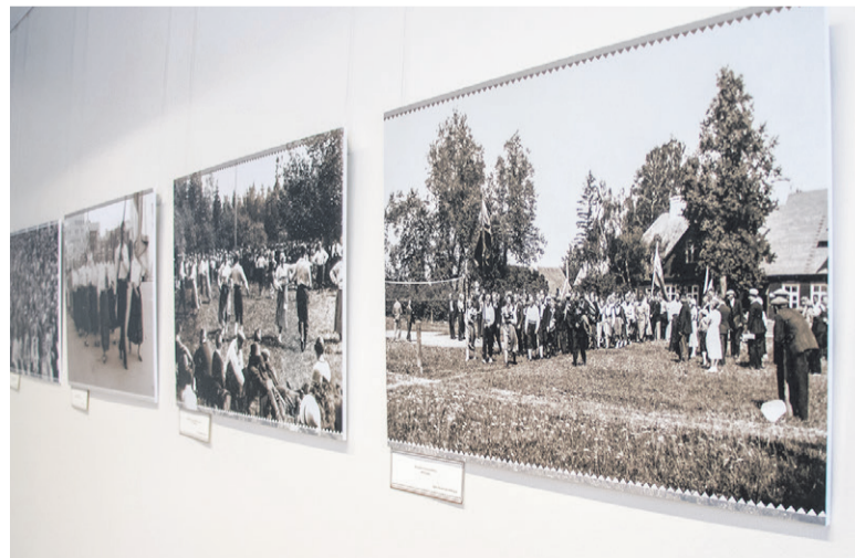
Kehtna raamatukogus on näitus avatud 29. märtsini.