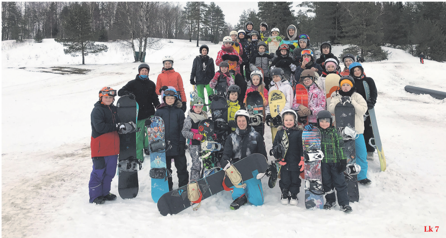
Paluküla lumelaulaagris osalejad.