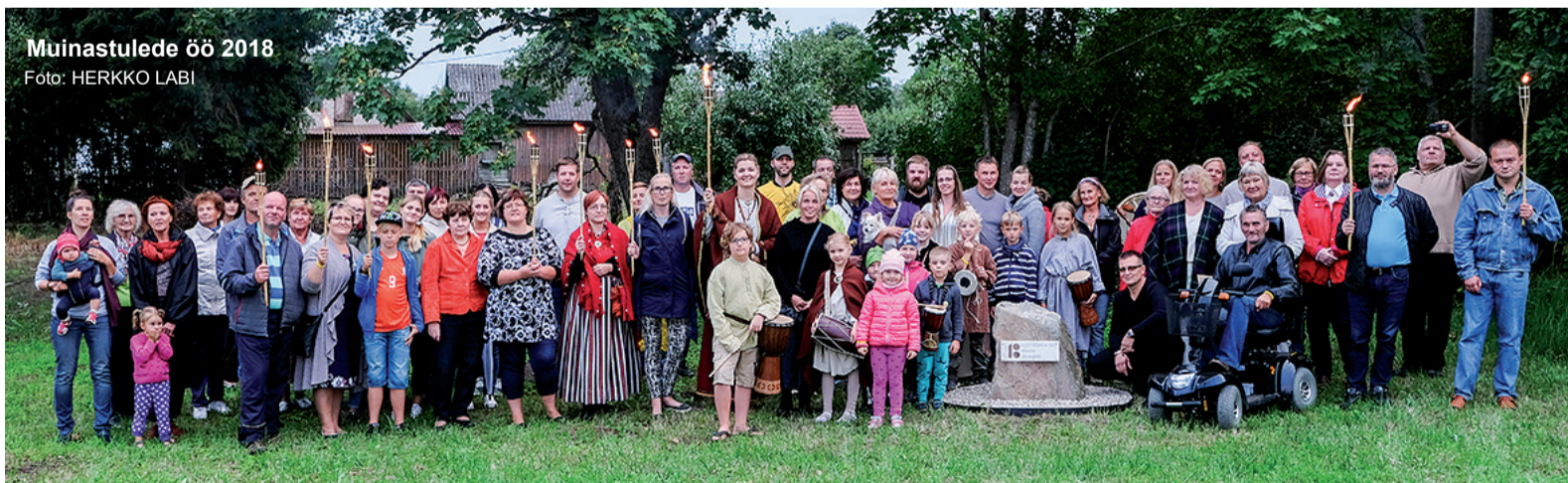
Muinastulede öö 2018

Selle aasta tippündmus oli loomulikult see, et Keava valiti Kehtna valla Aasta külaks 2018. Selline tunnustus näitab, et oleme õigel teel ja meie pingutused kannavad vilja. Paistame silma ka väljaspool Keava piire. Keava – ikka heaga!