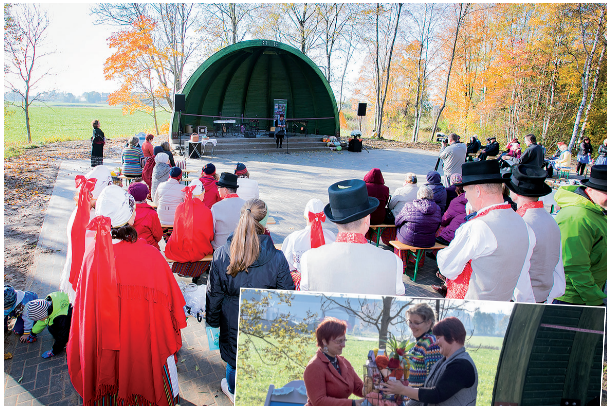
Kehtna uus laululava.

2019. a 7. juunil saame oma uuel laululaval võõrustada juubelilaulu- ja tantsupeo tuld. Anne Ummalas , Kehtna Kultuuriseltsi juhatuse liige