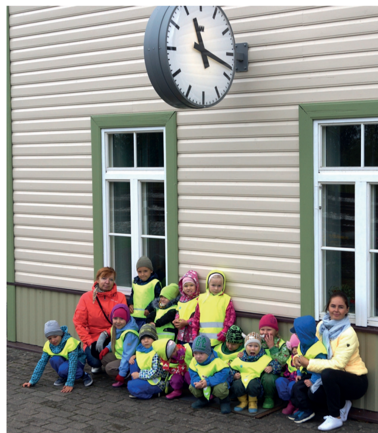
Lasteaialapsed rongi ootel.