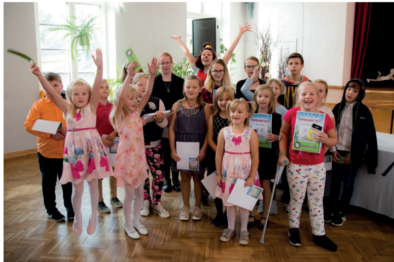
Kehtna suvelugejad 2017.

Suveraamatu programmist võttis sel aastal osa 486 last. Meie vallas