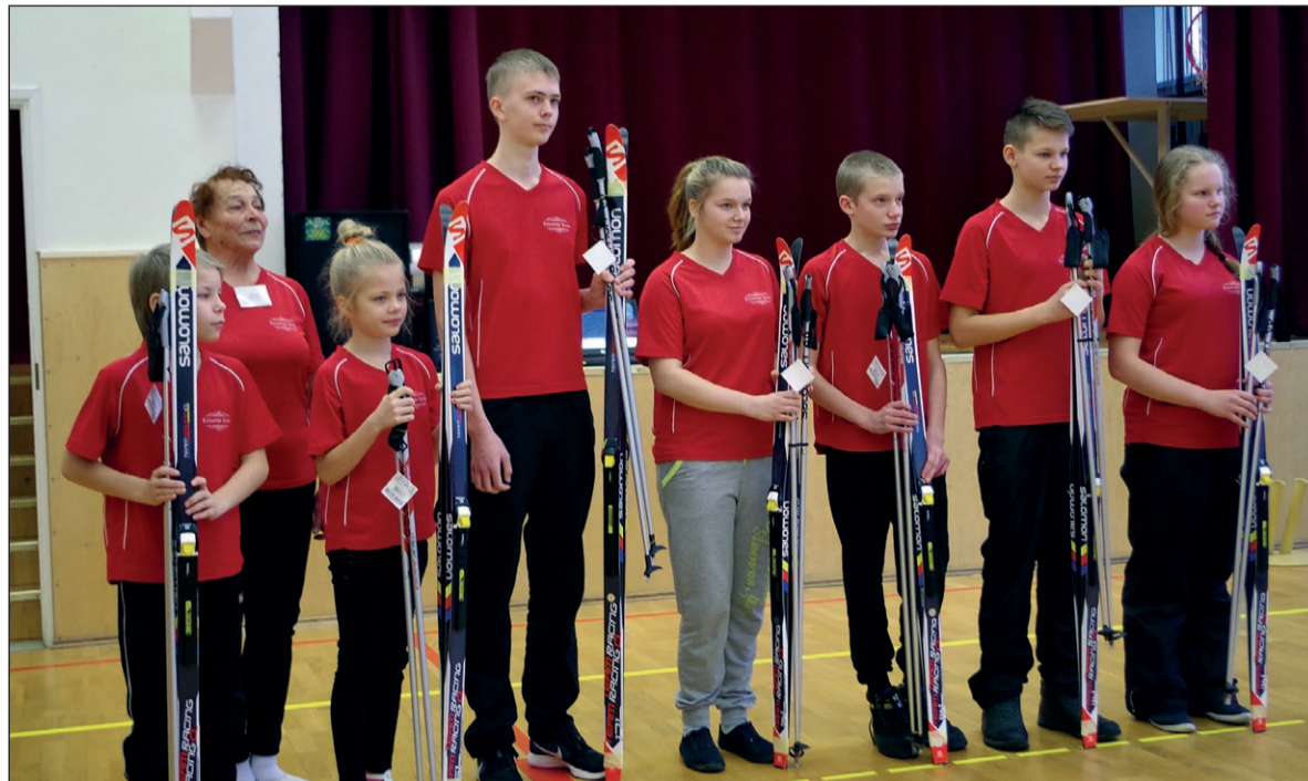
Eidapere lapsed suuskadega.

Pärast pidulikku osa oli kohale tulnud lastel võimalik aga suusad alla panna ning osa saada toredatest sportlikest tegevustest. Lastele oli spordirõõmu tulnud pakkuma Coca-Cola Fondi ja EOK ühisprogrammi „Liikumine teeb erksaks“ raames