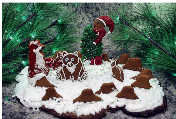
Üle-eestilisel PiparkoogiMaania fotovõistlusel 1. koht vanuserühmas 12-18 aastat - Kärt Pihlap ja Kristiina Tali (8. klass) tööga „Kingitus elule“.