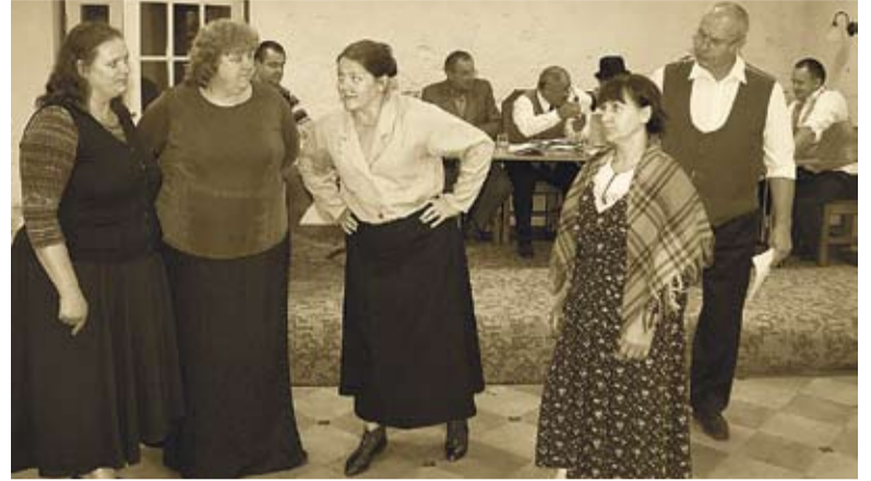
Rahulolematud lapsevanemad dokumentaalnäidendist „Inglise koolilugu“.

Päeva teine pool jätkus Inglise külaaktiivi korraldatud sportliku küla- peona. Muuhulgas peeti traditsiooniks saanud võistlusi - Jooks Mõisa Peale ja lustlik parvetamisvõistlus. Kuna ilm oli ilus, tuli rahvast parki järjest juurde. Klassikaaslased olid