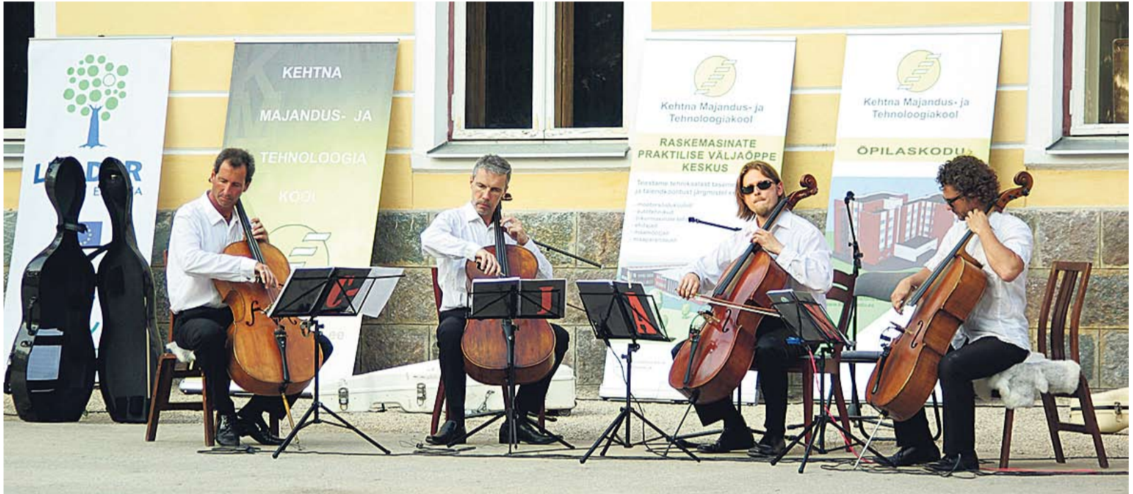
Tšellokvartett C-Jam (pildil) ja Hurmurid lõpetasid möisapäeva südamliku kontserdiga.