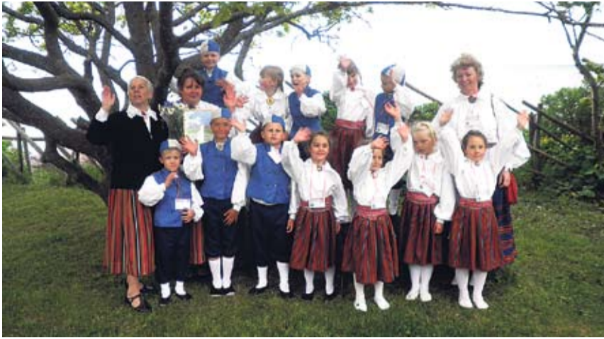
Rõõmu jagus väikestel tantsijatel igal hetkel – ei mingit väsimust!