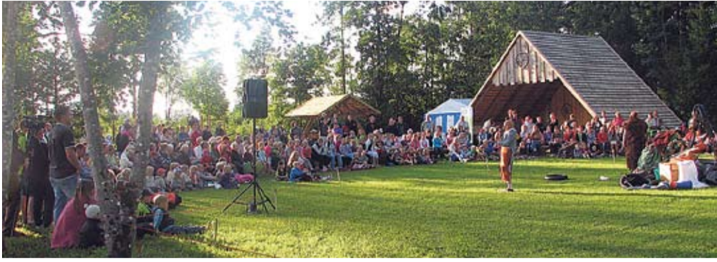
Naksitrallidega oli kohtuma tulnud hinnanguliselt kaks- ja poolsada teatrihuvilist.