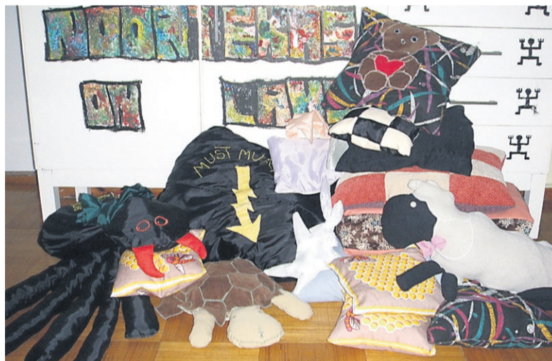
Noorte valmistatud padjad.

kodukandis. Loomulikult kuuluvad noorteõhtu juurde ka ülipõnevad tutvumis- ja osavusmängud.