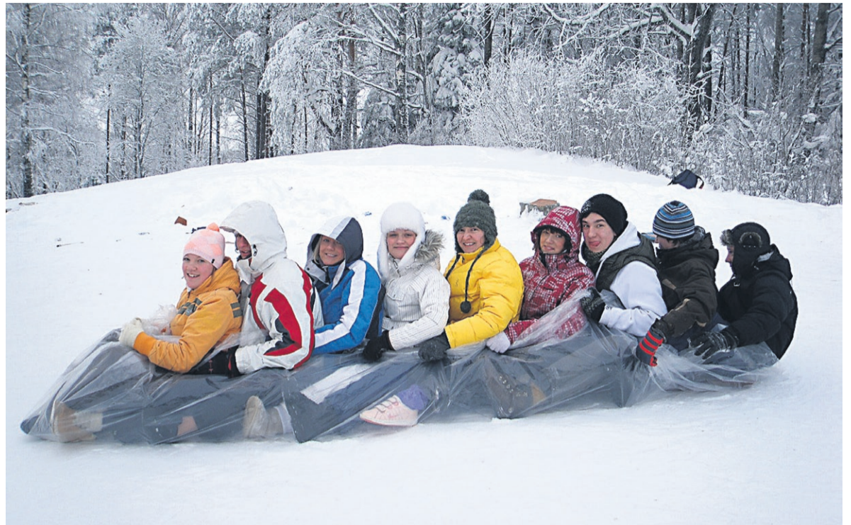
Noortekogu noored Palukülas.

Noortekogu läheb uusi liikmeid otsima valla eri piirkondadesse ning esimene noorteõhtu korraldatakse 26. veebruaril Lelles. Kell 19 algab jalgpallikohtumine Lelle noorte ja Kehtna noortekogu vahel. Pärast mängu tutvustab Kehtna noortekogu oma seniseid tegevusi ja eesmärke ning räägitakse sellest, miks on kasulik olla aktiivne noor oma