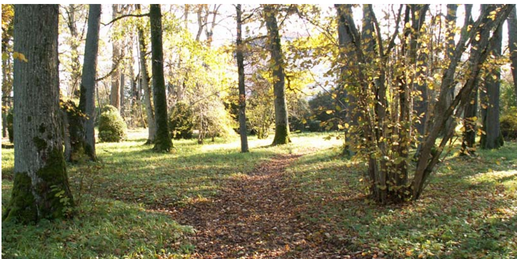
Keskkonnainvesteeringute Keskuselt saadi raha ka Kehtna mõisapargi korrastamiseks