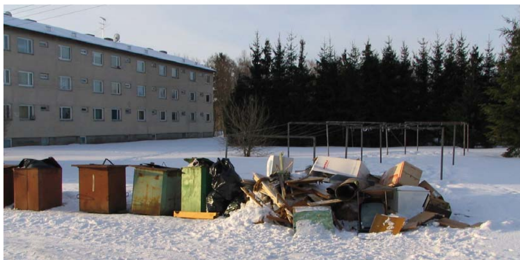
Näide Kehtna alevikust, kuidas ei tohi kasutada prügikonteinereid

Eskiislahendusega on võimalik tutvuda Valtu