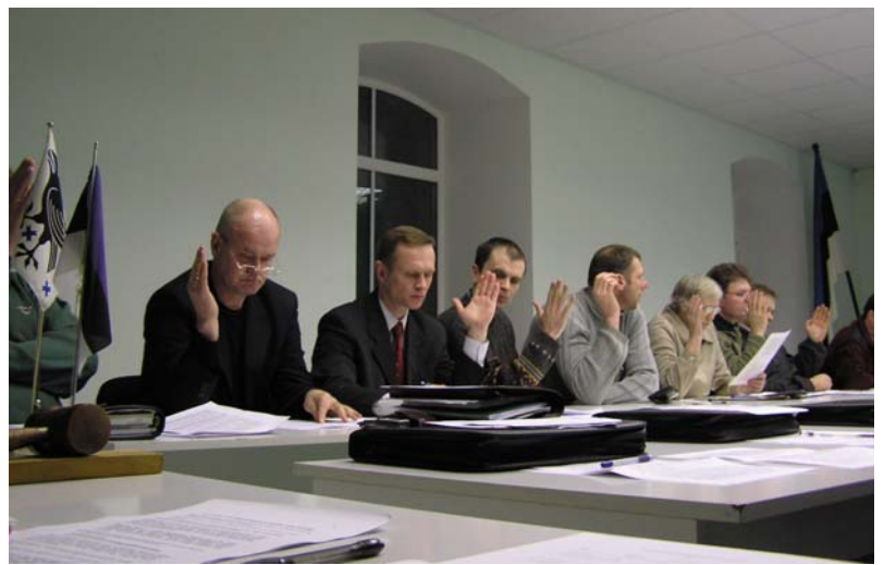
Kehtna Vallavolikogu Paluküla detailplaneeringut arutamas.

Kui Kehtna valla volikogu 9. detsembril suusakeskuse detailplaneeringu taas kehtestas, hääletasid volikogulased enne läbi kõik oponentide parandusettepanekutesse puutuva ehk rohkem kui 40 korda. Enamjaolt puudutasid