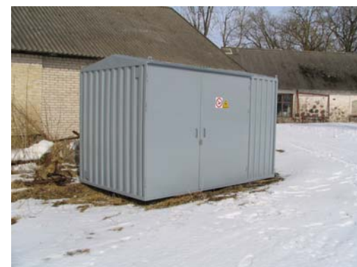
... ja välisvaade