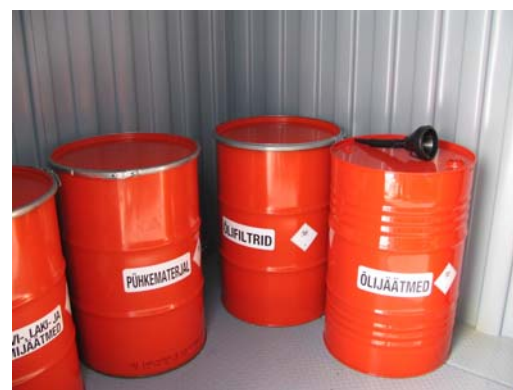
Ohtlike jäätmete kogumise konteiner Kehtnas - seestvaade...

Rõhutan veel kord, et nimetatud konteiner