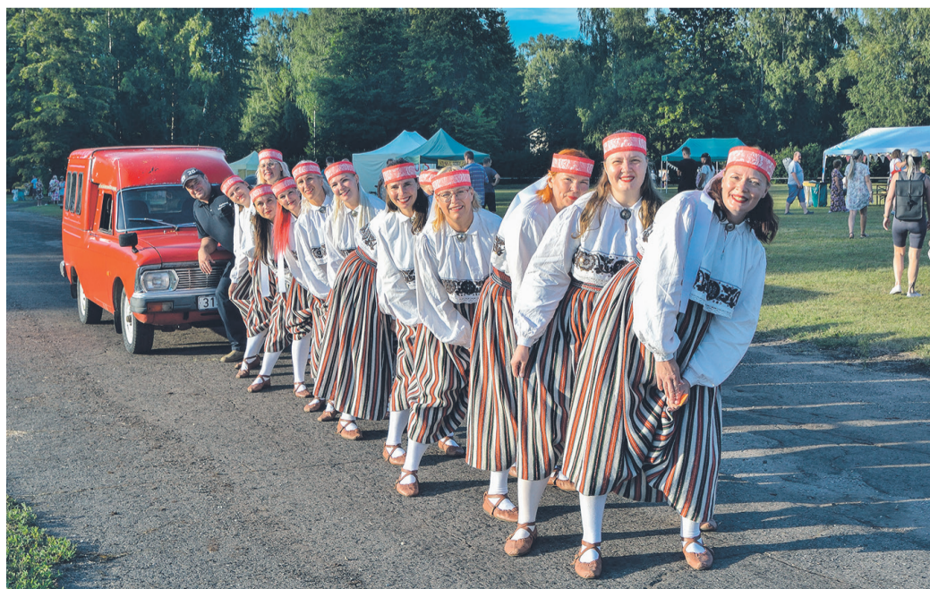
Valtu naisrühm seltskondliku rammuvõistluse Stardiabi rajal.