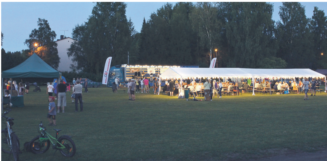
Kodukandipäev Kaerepere 610 piduõhtu. Esineb ansambel Brandy.