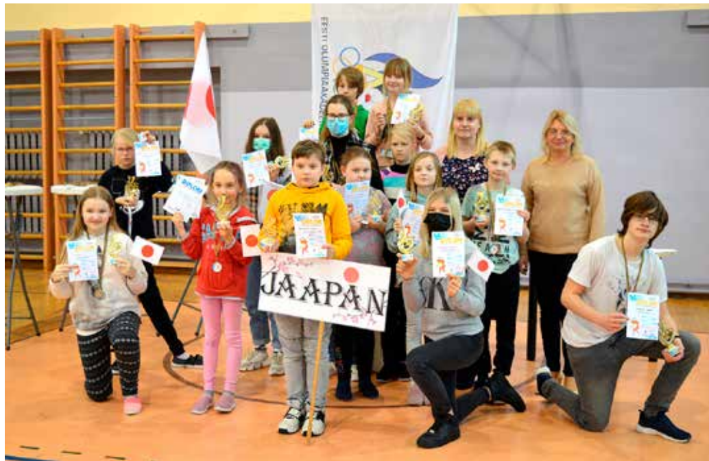
OM-i üldvõitja Jaapani võistkond võidukarikatega.

11.02 laskesuusatamine kõi- gile õpilastele 4 vanusegrupis. Võisteldi nagu päris laskesu- satamises: sõiduring, lasketiir, trahviring ning lõpuring (ringide ja lasketiirude arv sõltus vanu- segrupist). Väike erinevus oli muidugi, et püsside ja märkide asemel olid mängus tennisepal- lid ja ämbrid, kuid kõik teenitud