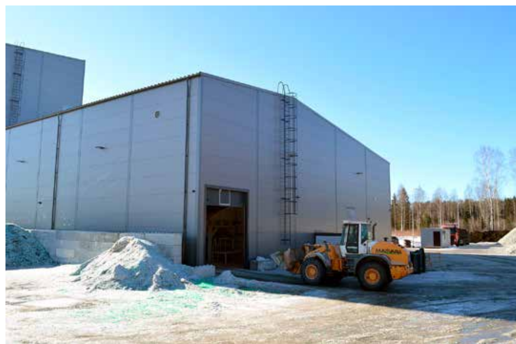
Klaasvahtkillustiku tehas Järvakandis.