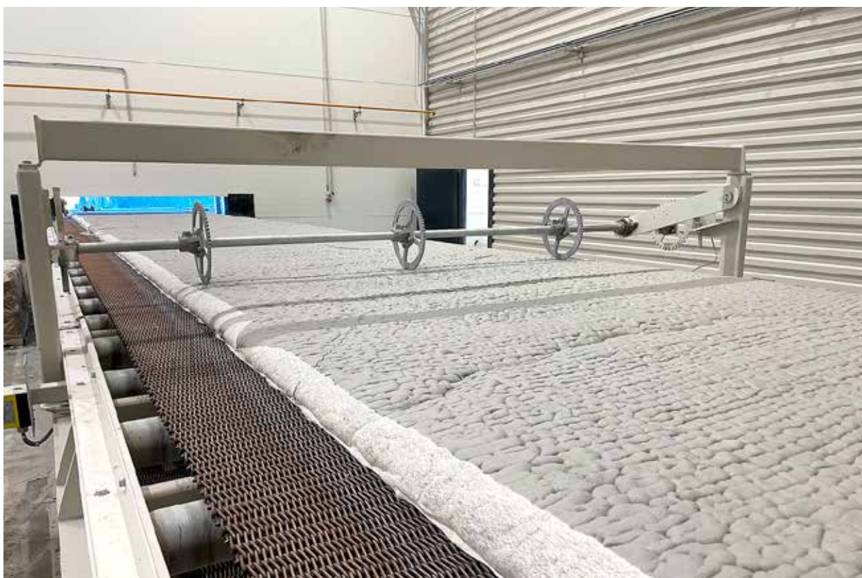
Lõpptoode – kergkillustik VitriCel tulemas tootmisliinilt.

Klaasvahtkillustiku tehas on ainus selline ettevõtte terves Baltikumis ja modernseim hetkel maailmas. See