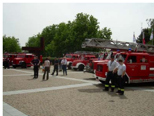
Osake vanade tuletõrjeautode paraadi sõidukitest.

Veelgi hinnatum on elukutselise pääste-teenistuse töötaja amet. Saksamaal väärtustab rasket ja ohtlikku tööd, juba riikliku tuletõrje kursandi palk on 2 000 eurot, esimesi aastaid töötaval väljaõpetatud mehel 2 500 eurot kuus puhtalt kätte. Nõuded tuletõrjujale on rasked – tehniline kutseharidus, millele lisandub väljaõpe tuletõrjekoolis, iga 6 kuu järel tuleb läbi tõsised füüsilised katsed.