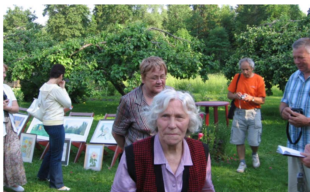
Kunstinäitus Kukemetsa talus külavanema koduõues.