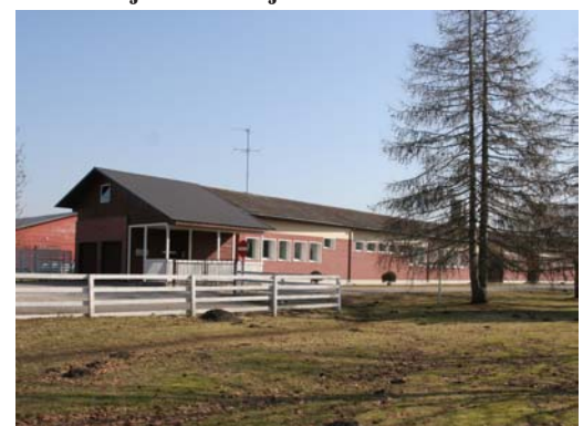
Eesti Tõuloomakasvatuse Ühistu hoone.