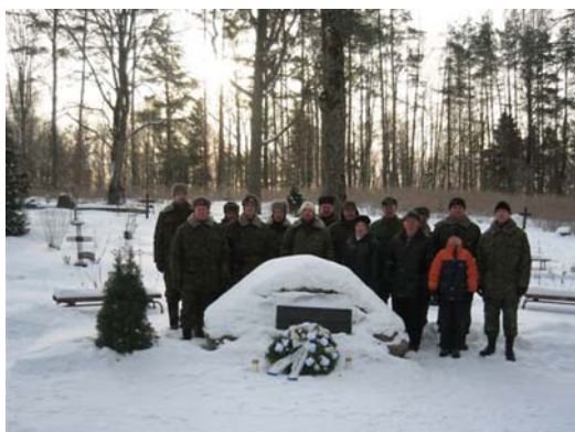
Üritusest osavõtjad.

Kaitseliidu Lelle rühm heiskas Eesti Vabariigi aastapäeval pidulikult lipu rahvamaja juures ja asetas pärja kalmistul asuva Eesti eest langenute mälestuskivi juurde. Langenuid mälestati kolme aupauguga.