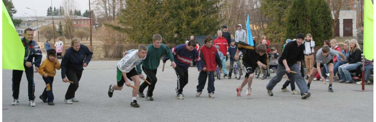
Pildil möödunud aasta teatejooksu start.

Teisipäeval, 24. aprillil kell 19.00 antakse Kehtna Majandus- ja Tehnoloogiakooli ees start XXXVIII Jüriöö teatejooksule.