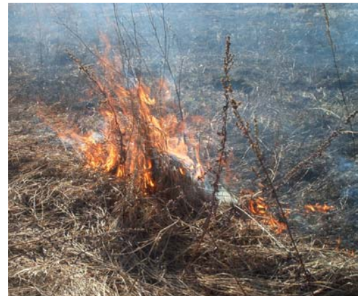
Nii ta algab...

tuleohutusnõuete kinnitamise määruse muutmise määrus hakkab kehtima kolm päeva pärast Riigi Teatajas ilmumist.